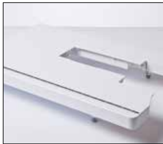
Table d'extension extra-large

Idéal pour les ouvrages de quilting. Ce cadre robuste permet à votre tissu de rester tendu et convient aux tissus lourds. Parfait pour les débutants et les passionnés.