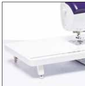
Table d'extension extra-large

Agrandissez votre plan de travail avec cette table d'extension extra-large. Idéale pour les ouvrages de quilting et de couture de grande taille. La table dispose d'une règle et d'un espace de rangement pour votre genouillère.