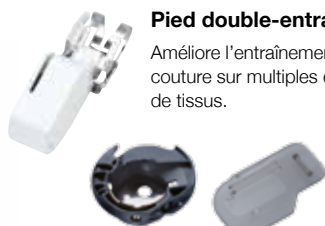
Table d'extension, poignée couture libre, guide couture, pied quilting ouvert, pied quilting 1/4" et pied double-entraînement.