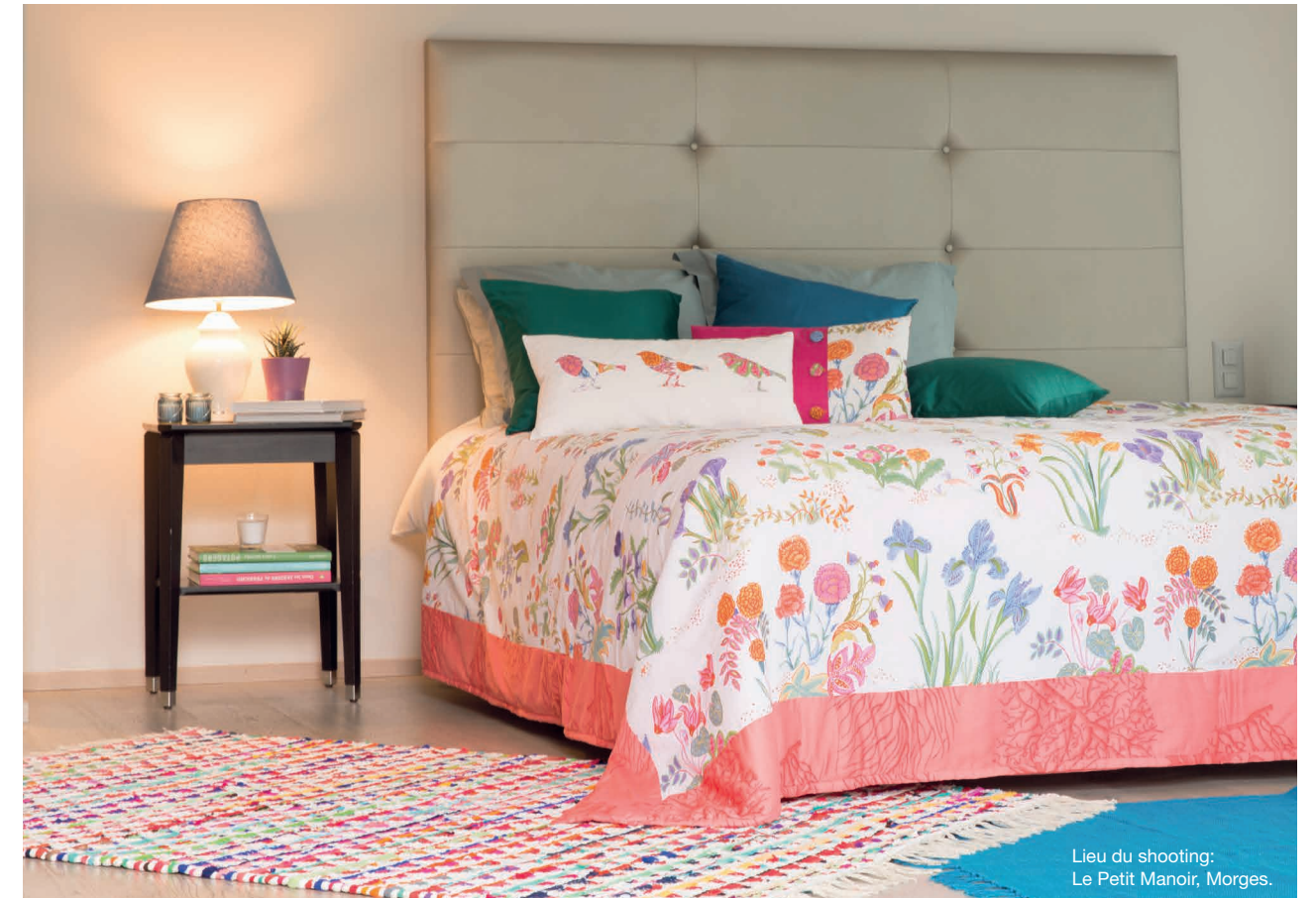
Lieu du shooting: Le Petit Manoir, Morges.

DE NOMBREUSES FONCTIONNALITÉS TRÈS PRATIQUES RENDENT VOS TRAVAUX DE COUTURE PLUS FACILES, PLUS RAPIDES ET PAR CONSÉQUENT PLUS AGRÉABLES.