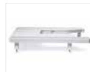
Table d'extension extra-large

Réalisez des coutures "à l'envers" (avec l'envers du tissu orienté vers le haut) en utilisant des fils décoratifs spéciaux trop gros pour le chas de l'aiguille.